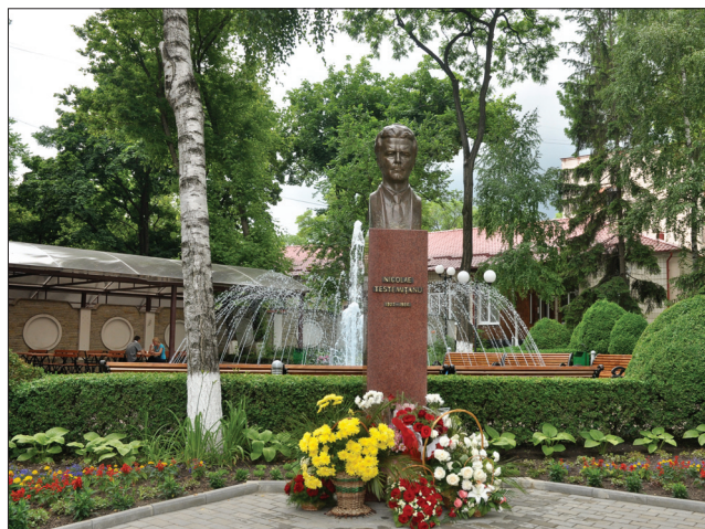
Bustul lui Nicolae Testemițanu în curtea Universității ce-i poartă numele

În anul 2003, prin Legea nr. 268-XV din 27 iunie cu privire la distincțiile de stat ale Republicii Moldova, a fost instituită Medalia „Nicolae Testemițanu” care se conferă pentru merite deosebite în dezvoltarea ocrotirii sănătății, farmaceuticii, balneologiei, medicinei preventive și științei medicale. În memoria lui Nicolae Testemițanu au fost numite străzi, inaugurate plăci comemorative, busturi și monumente. La USMF „Nicolae Testemițanu” este instituită bursa de merit „Nicolae Testemițanu” pentru studenți și doctoranzi.